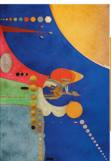
Zemaj - Verso il bene comune