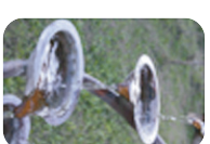
Centro di Armonia

Con mani umane e per il futuro dell'Arte Medica